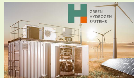
Green Hydrogen Systems Produktion af grøn brint