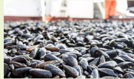
Blå Biomasse Muslingeprotein og kvælstof rensning i Limfjorden