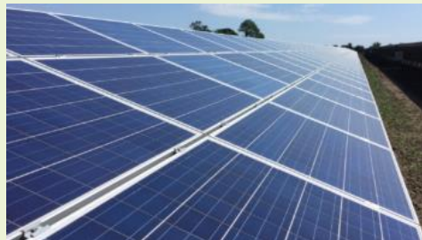
Better Energy Solcelleanlæg