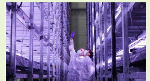
Nordic Harvest Vertikal farming