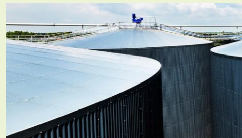
Nature Energy Biogas