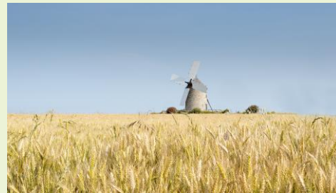
Meelunie Plantebaseret protein