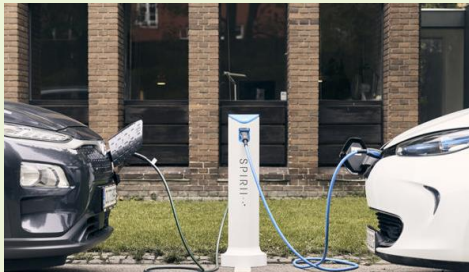
Spirii Ladestandere og infrastruktur